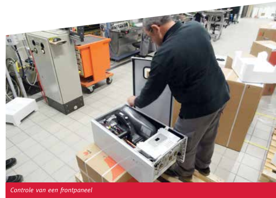
Controle van een frontpaneel

In ons lab werken 4 mensen. Onafhankelijk van onze dienst Onderzoek & Ontwikkeling en onafhankelijk van onze productie-eenheden en andere afdelingen. Hun opdracht: ongeveer 80 verschillende testen uitvoeren volgens strikt vastgelegde procedures. Zijn de toestellen stevig en correct in elkaar gezet? Is voldaan aan alle normen en kwaliteitseisen? En vooral: is er een absolute zekerheid op een veilige werking?