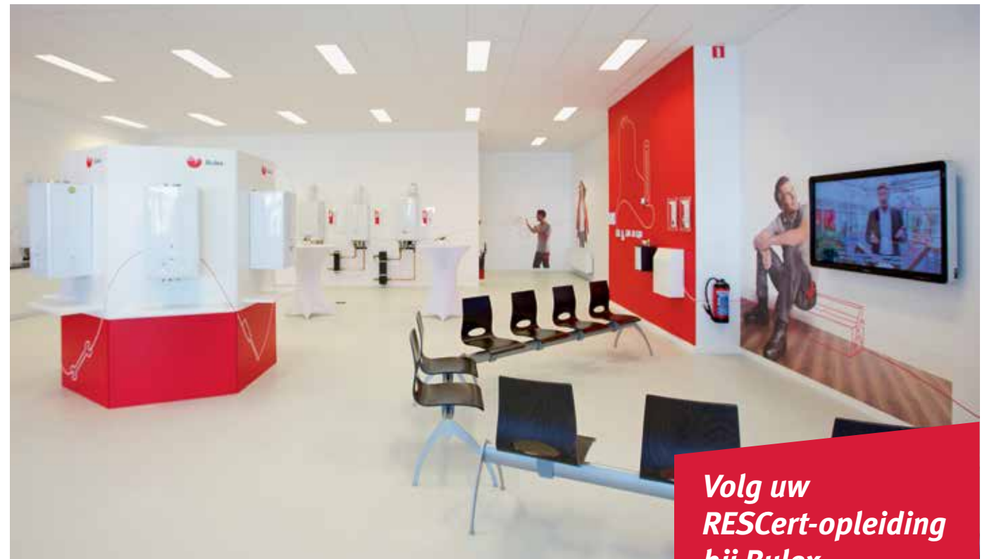
Het opleidingscentrum in Destelbergen