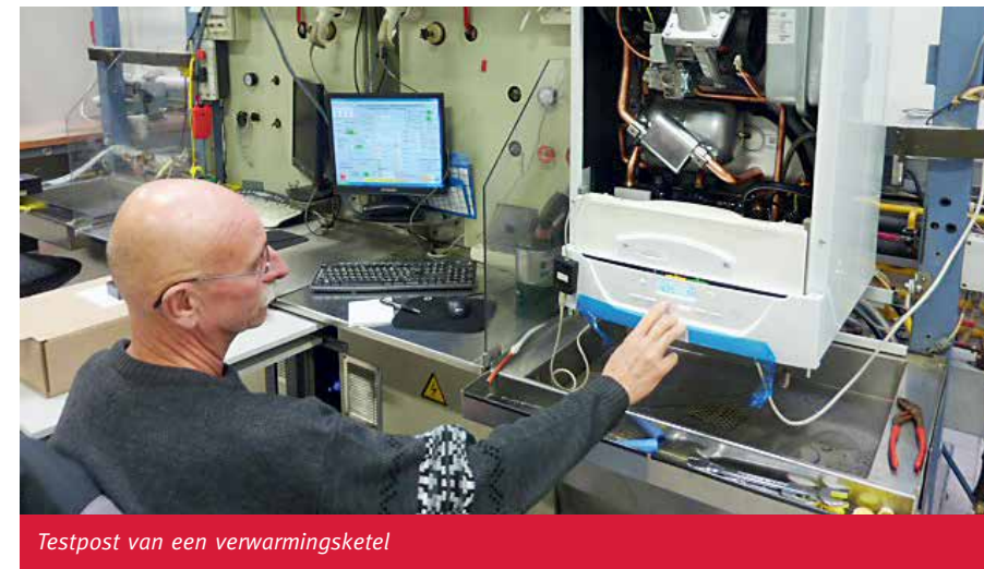
Testpost van een verwarmingsketel