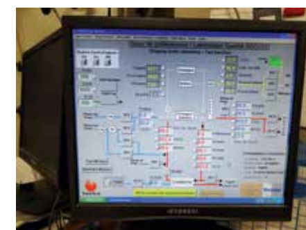
Interface de commande des bancs d'essai chaudières (visualisation des circuits et des valeurs mesurées)

Équipement de mesure, outillages de toutes sortes, ordinateurs,... Bienvenue dans notre laboratoire qualité de Nantes. Ici, nous testons les appareils qui viennent d'être terminés. Régulièrement, nous prélevons aléatoirement un produit pour le soumettre à un contrôle détaillé.