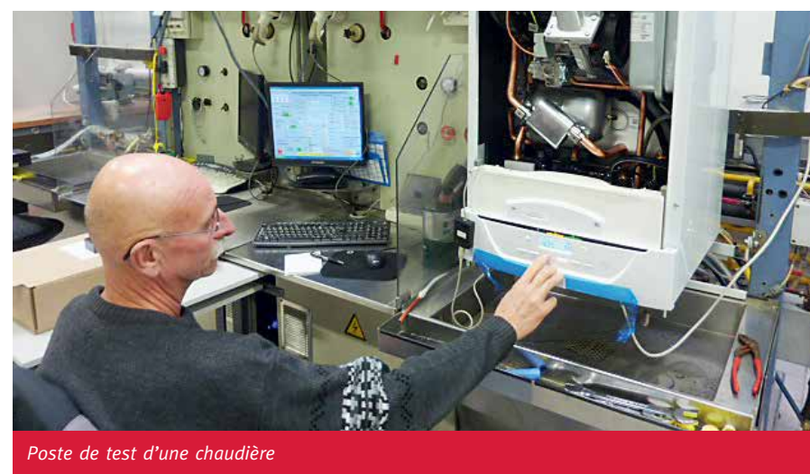
Poste de test d'une chaudière