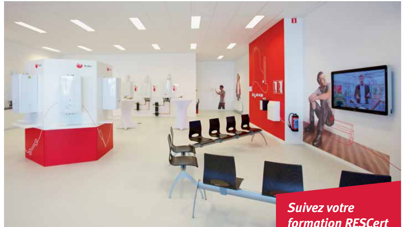
Le centre de formation à Destelbergen

Après la pause, place au travail proprement dit. Nous descendons dans la salle de mise en pratique, très lumineuse et conviviale grâce à ses grandes baies vitrées. À droite, des chaudières de condensation sont fixées au mur, raccordées au réseau de gaz et au réseau électrique. Au bout, nous apercevons les régulateurs. Et un peu plus loin, un toit en bâtière supportant des collecteurs solaires : intégrés et placés en surimposition. Les boilers solaires, pompes à chaleur et systèmes de climati-