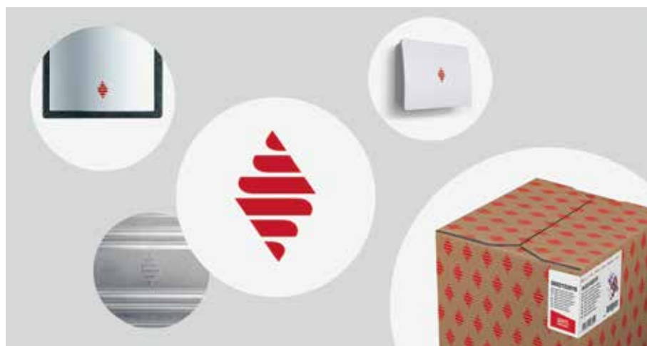
Vous verrez bientôt ce logo sur les accessoires. Le logo Bulex avec le petit oiseau rouge est conservé sur les appareils Bulex (chaudières, pompes à chaleur, ...).

Travaillez sans souci et offrez le meilleur à vos clients. Faites exclusivement confiance à l'original. Vous reconnaîtrez l'original au logo Dynamic Wings.