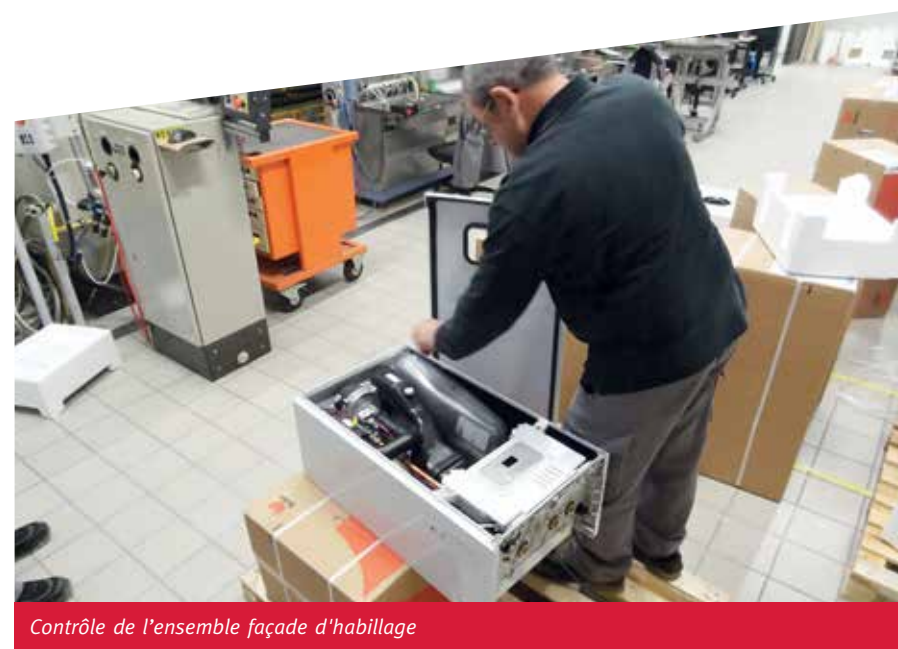
Contrôle de l'ensemble façade d'habillage